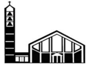
St. Karl Borromäus